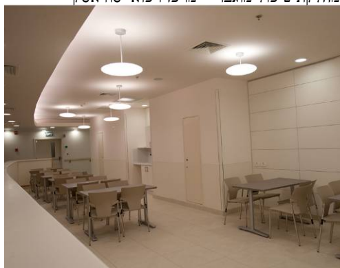
מחלקת טיפול מוגבר – מרכז רפואי סוראסקי