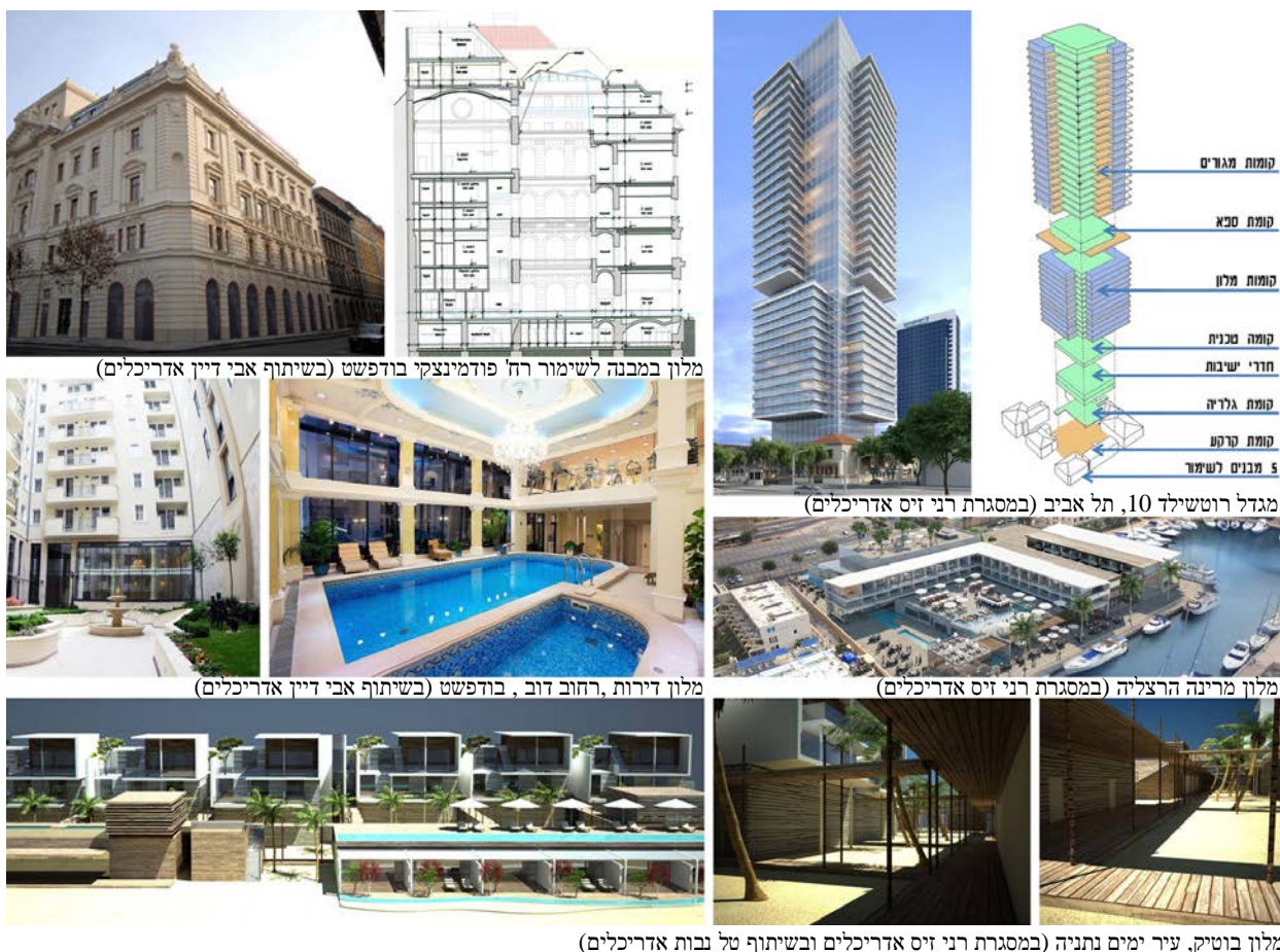
מלון במבנה לשימור רח' פודמינצקי בודפשט (בשיתוף אבי דיין אדריכלים)