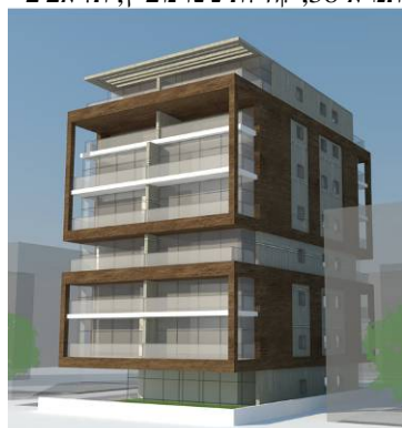
תמ"א 38, רחוב זכרון יעקב, תל אביב