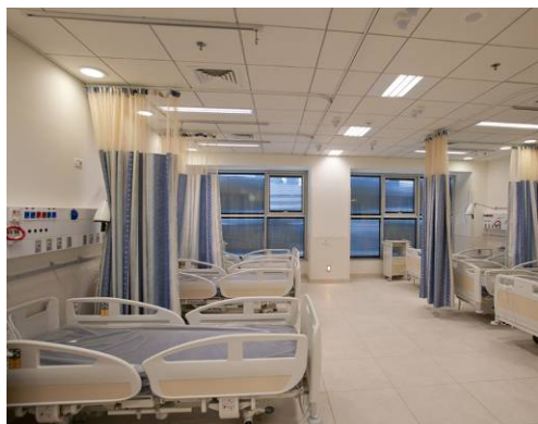
מחלקת טיפול מוגבר – מרכז רפואי סוראסקי

אנחנו אדריכלים בעלי ניסיון רב שנים בתכנון וליווי של מרפאות פרטיות ומחלקות בבתי חולים. אנו מלווים קליניקות פרטיות, וגופים ציבוריים, המעוניינים בתכנון הוליסטי ופונקציונאלי לצד רגישות לחוויית המשתמש.