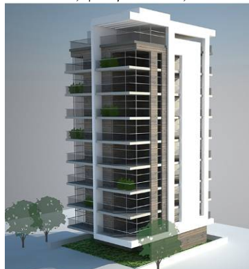
תמ"א 38, שדרות ירושלים, רמת גן