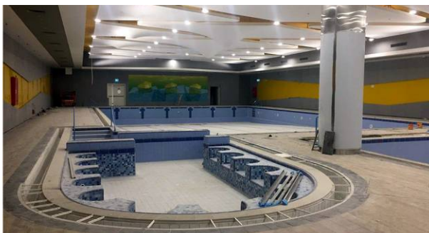
מרכז הספורט – השוק הסיטונאי (במסגרת אליקים אדריכלים)