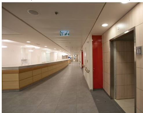
מחלקת ניורוכירוגיה – מרכז רפואי סוראסקי