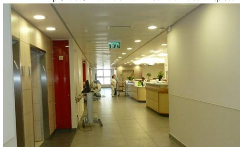
מחלקת ניורולוגיה – מרכז רפואי סוראסקי