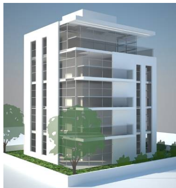
תמ"א 38, קהילת טשרנוביץ, תל אביב

אנחנו אדריכלים המתמחים בהליך התחדשות עירונית, ומלווים יזמים והתארגנויות דיירים המעוניינים בהליכי תמ"א 38 עיבוי ופינוי בינוי. אנו מעניקים ליווי אדריכלי מקצועי, מהיר ונגיש, החל מבדיקת ההיתכנות הראשונית, מתן היתר ועד לליווי הביצוע.