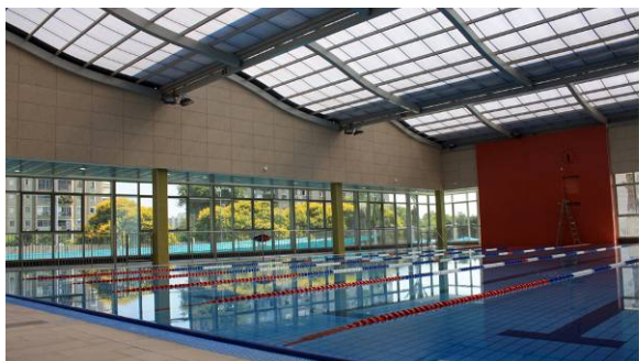
בריכה מקורה בית בארבור 2013 (במסגרת אליקים אדריכלים)