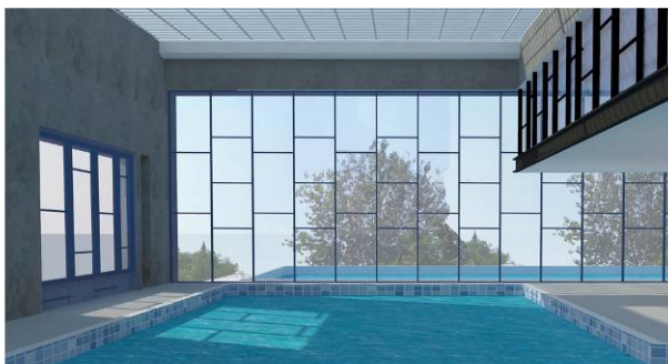
מבנה לבריכה מקורה, וחדר כושר (2017), סביון