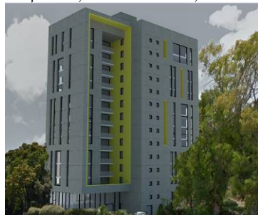
תחרות, מעונות סטודנטים לרפואה